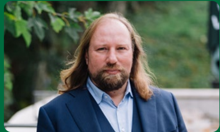
Dr. Anton Hofreiter MdB Europaausschuss-Vorsitzender im Deutschen Bundestag

„Die Europawahl 2024 ist so wichtig wie keine zuvor. Es geht um die Handlungsfähigkeit der Europäischen Union in schwierigen Zeiten und um eine Mehrheit für die demokratischen Kräfte im Europaparlament. Die grüne Fraktion muss so stark wie möglich werden, damit die EU weiter der Motor für Klimaschutz, grüne Innovationen und nachhaltiges Wirtschaften bleibt. Davon profitiert auch der Landkreis München.“